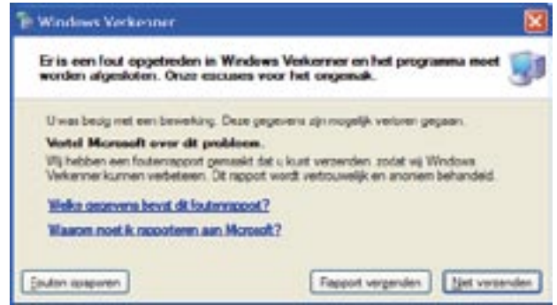
Afbeelding 1. Foutmelding interface-inheritance

Nu we de gewenste data tot onze beschikking hebben, kunnen we verder gaan met het implementeren van de overige functionaliteit.